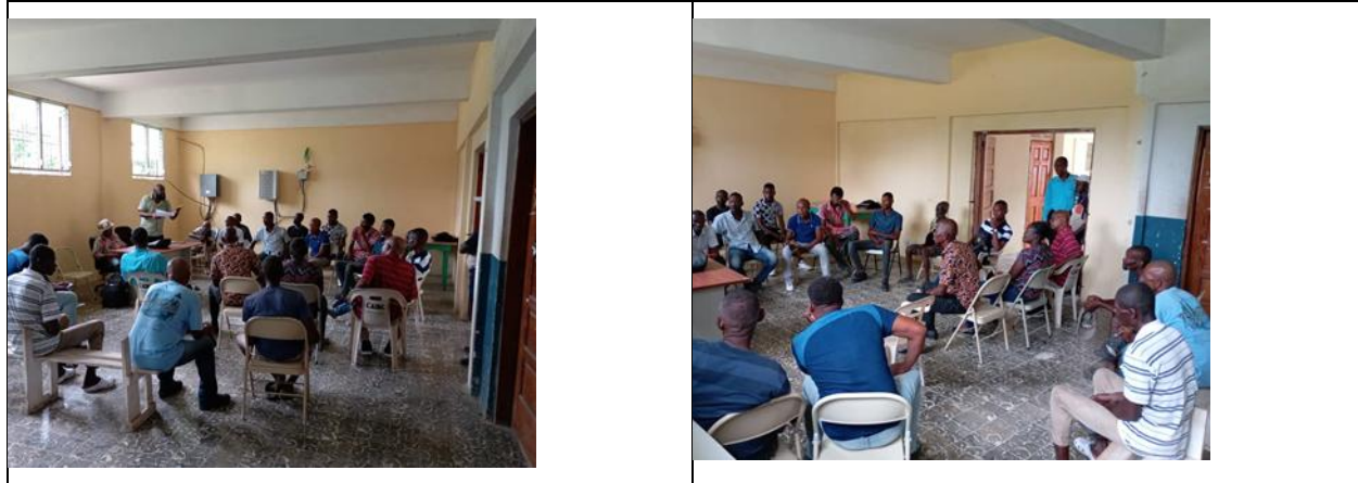
Consultation des parties prenantes à la Mairie de Chantal