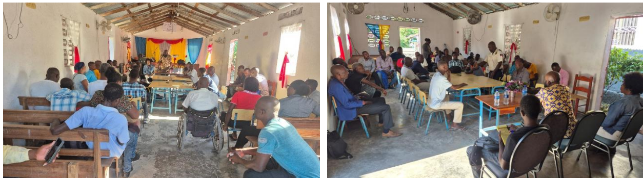
Figure 5. Consultation à Chantal

Le procès-verbal de la consultation de juillet 2024 est en annexe 2.