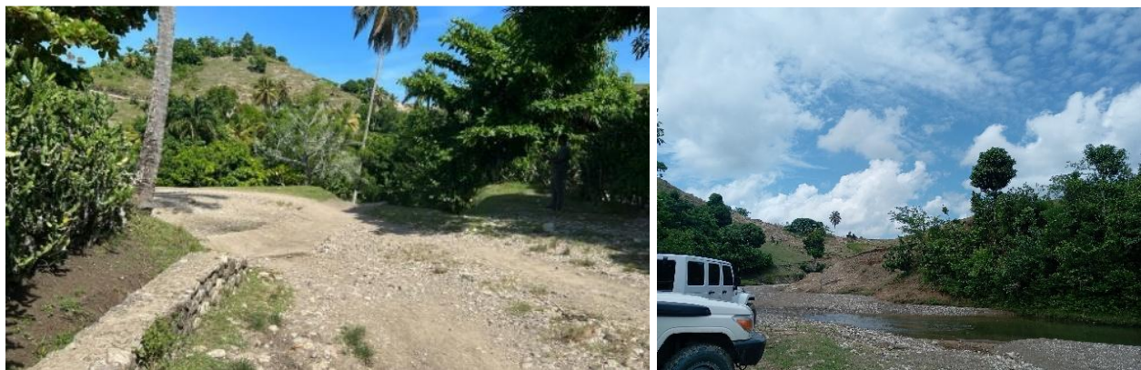
Figure 6. Jardins qui seront affectés par les travaux

Pour les arbres coupés, il est prévu une compensation qui doit être appliquée au cours de la mise en œuvre du PGES ; soit la plantation de cinq (5) arbres pour chaque arbre coupé en respectant l'environnement écologique de la zone.