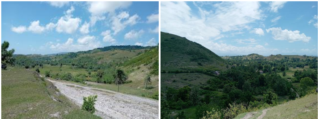
Figure 4. Parcelles agricoles en exploitation

Sur les tronçons Briyer – Château et Château – Carpentier, la culture du vétiver apporte un revenu aux ménages.