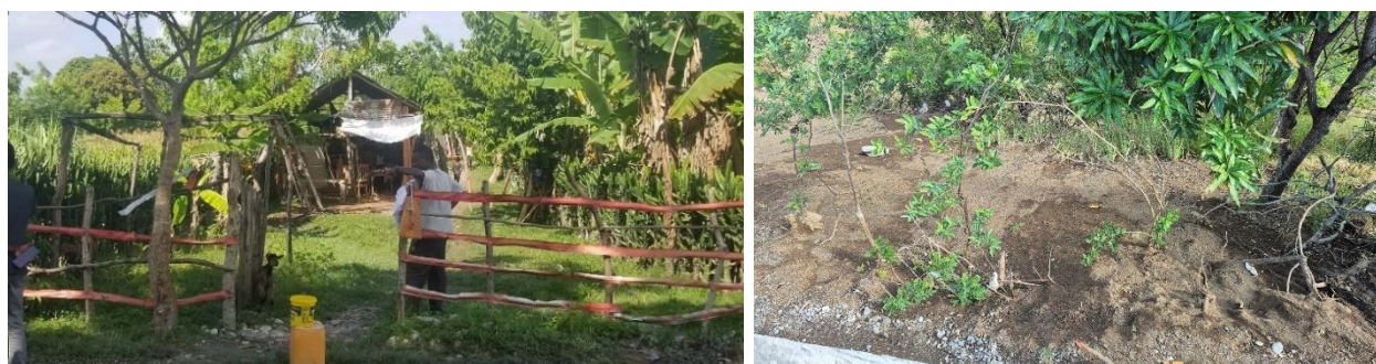
Figure 10. Ebénisterie et jardin de vétiver qui seront temporairement perturbés