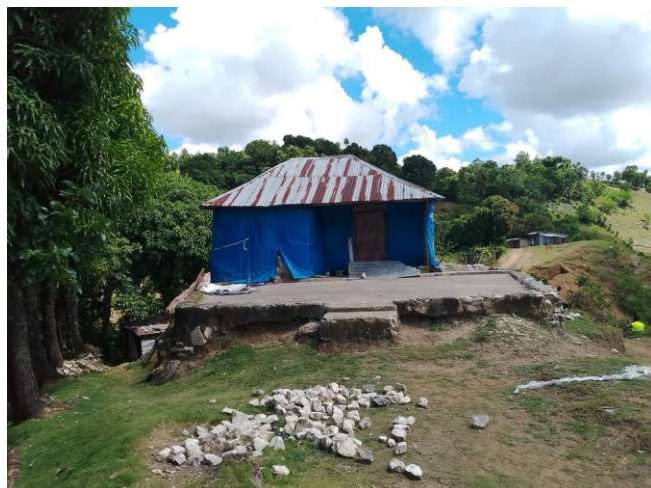
Figure 7. Maisonnette qui sera démolie et reconstruite