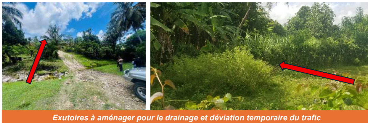
Figure 9. Parcelles temporairement affectées